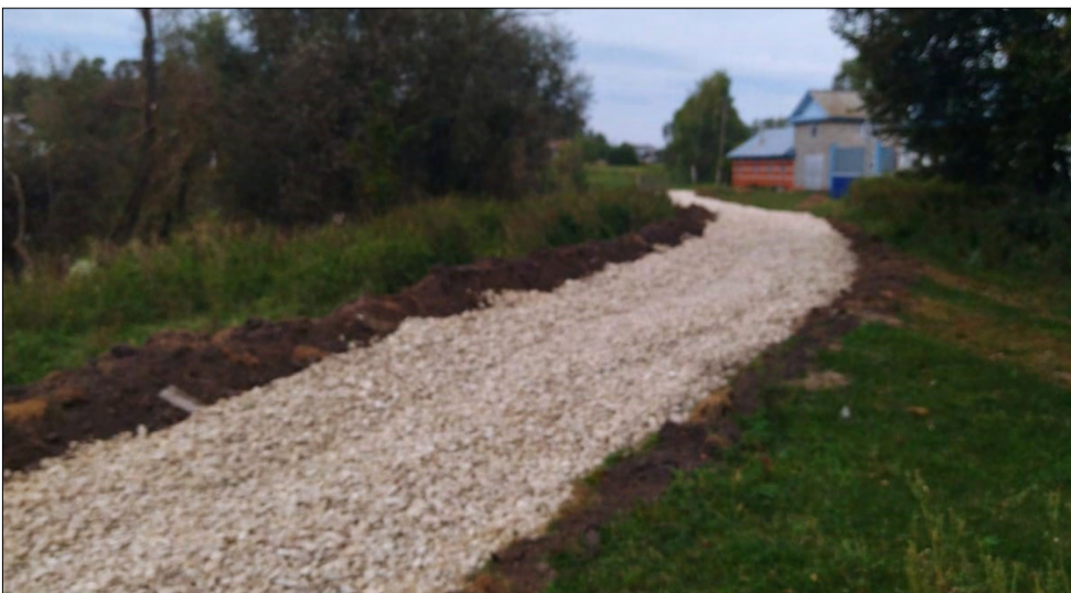
Автанкасси сүлө яла хәт кёртет.

Проект Чәваш Ен Цифра министрствы пуләшнине пурнаҗсланать.