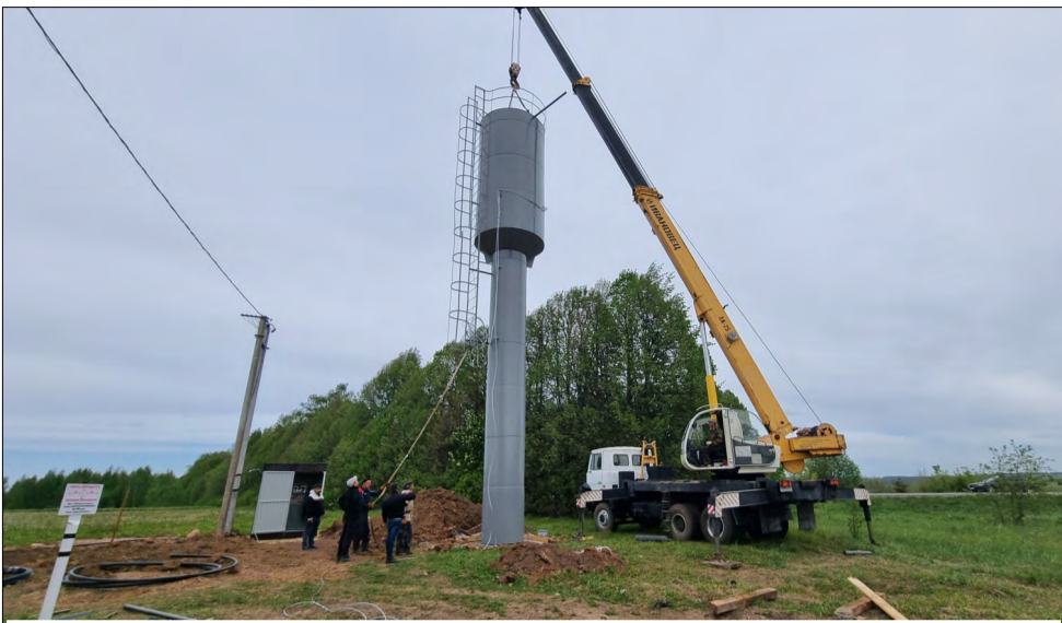
Анаткас Хачәкра шыв башни лартаҗҗё.