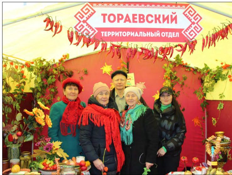
Турайсем октябрэн 13-мешенче Тыр-пул уявенче.