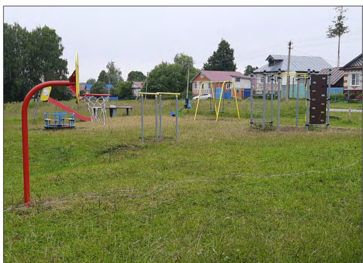
Уйкас Турай ялэнчи ачасен пушә вәхәта усаллә ирттерме майсем сук мар. Ача-пәча вайя площадкине пелтер хута янә.

Евгений ОРЛОВ, Турай территории пайён пусләхә: