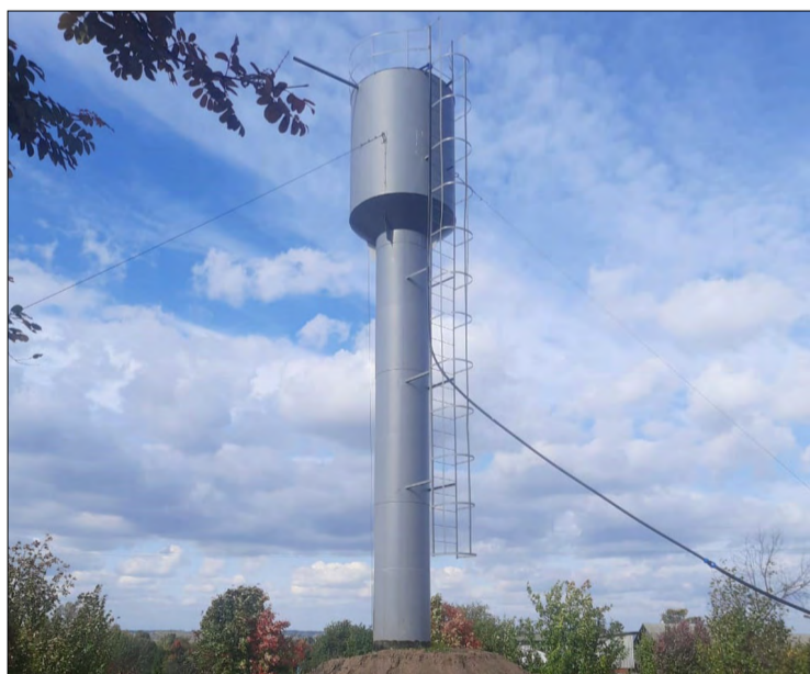
Анаткассинчи Октябрьская урамра халё сөнё шыв башни.