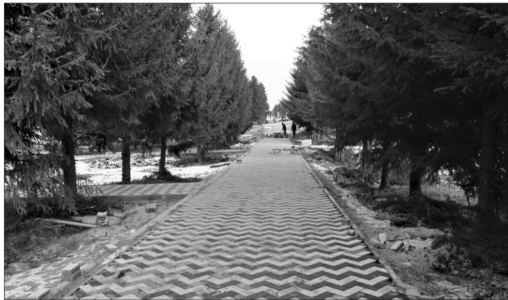
Парки тĕп сүл.