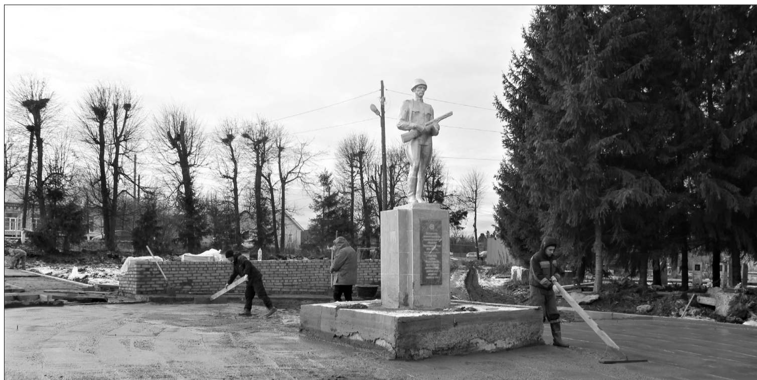
Строительсем паркне палăк таврашĕнчи ĕссене пурнăслаççĕ.

Хăш-пĕр сĕрте брусчатка сарса пĕтермен вырăнсем пур. Ку ĕсе пурнăслакансем те пурчĕ паркне. Парка строительство мате-